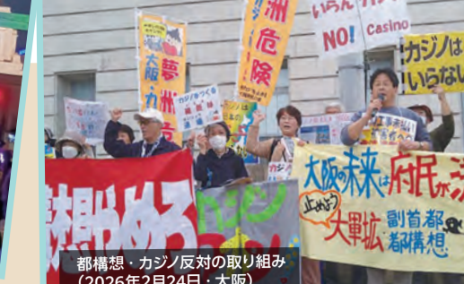
都構構・カジノ反対の取り組み (2026年2月24日・大阪)