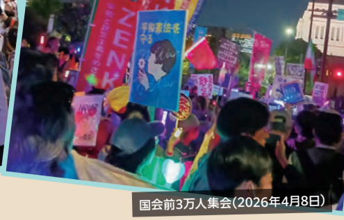
国会前3万人集会(2026年4月8日)