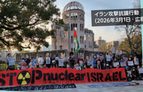
イラン攻撃抗議行動 (2026年3月1日・広島)