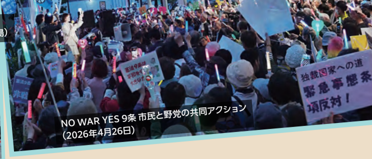
NO WAR YES 9条 市民と野党の共同アクション (2026年4月26日)