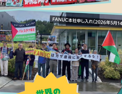
FANUC本社申し入れ(2026年5月14日)