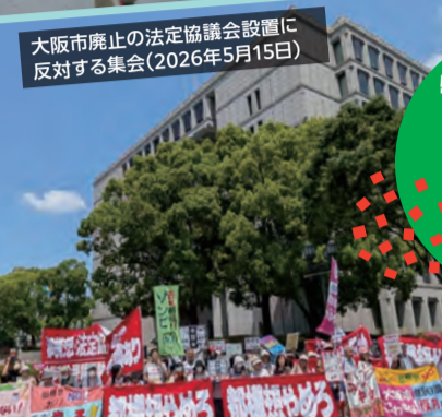
大阪市廃止の法定協議会設置に反対する集会(2026年5月15日)