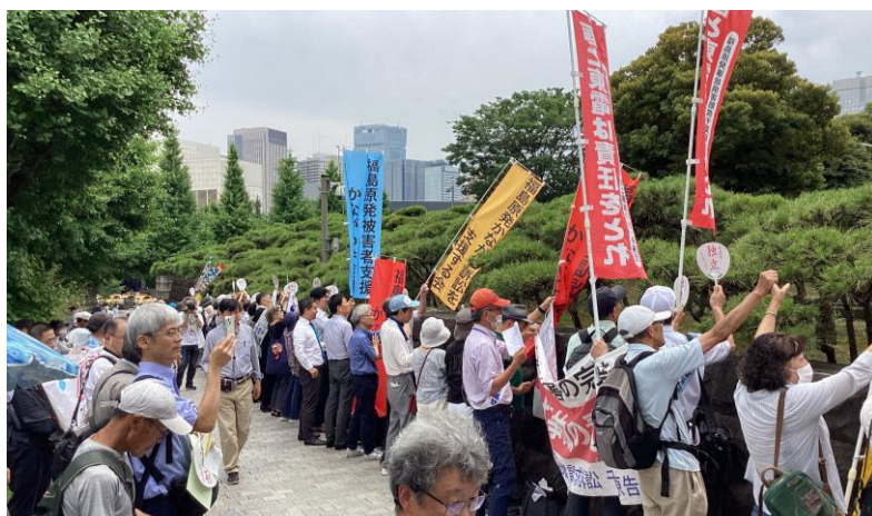
950人が集まった6/17最高裁共同行動

★この6.17判決を覆すため、今年6月17日に、多数が集まり、「司法の劣化を許さない」と最高裁をヒューマンチェーンでとり囲み、新たな運動が始まりました。