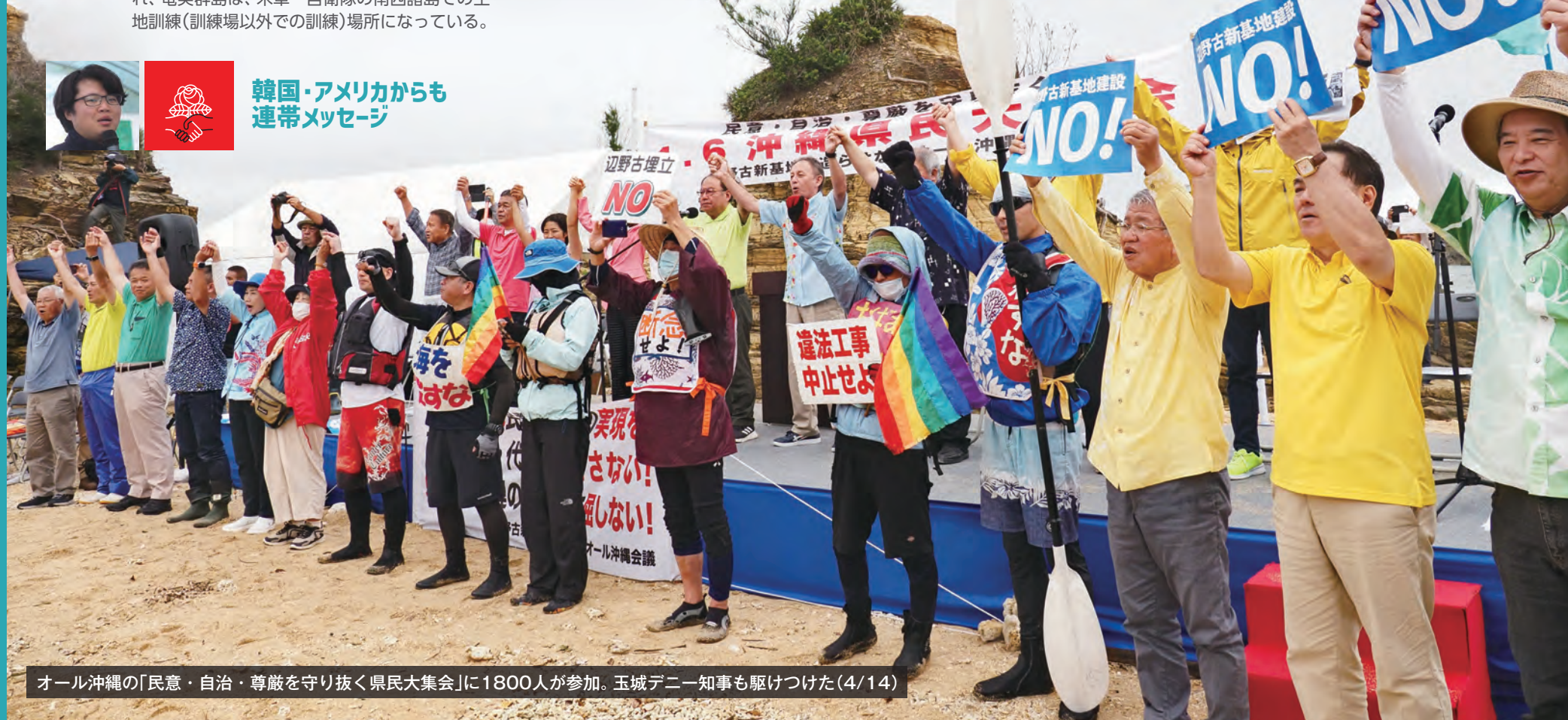
オール沖縄の「民意・自治・尊厳を守り抜く県民大会」に1800人が参加。玉城デニー知事も駆けつけた(4/14)