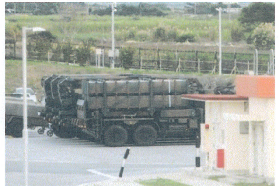
ミサイル発射台を搭載した車両(自衛隊宮古島基地) 戦時に移動してミサイルを発射する

しかし、軍事力一辺倒で平和はつくれません。今の沖縄の現状を、ぜひ見に来て下さい。