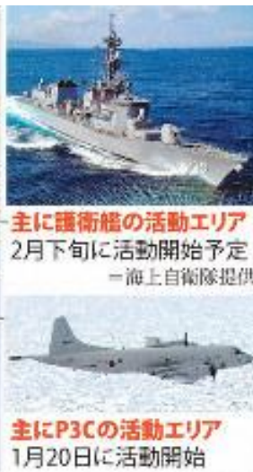
中東に派遣される海上自衛隊の部隊と活動範囲(毎日新聞2020年1月19日)