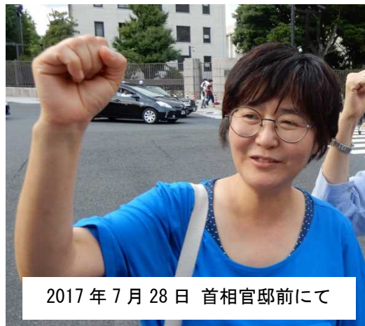
2017年7月28日 首相官邸前にて